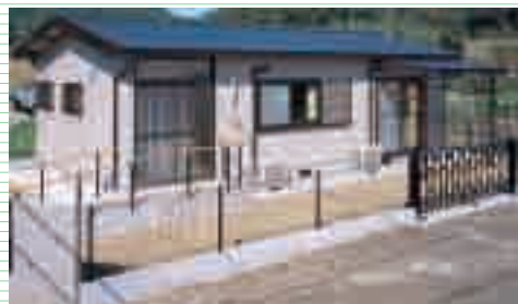
※介護プランもあります。 A-TY-12.5坪(切妻)

悠々自適のご夫婦には、自由度が高い離れタイプをお勧めします。ゆとりの暮らしと、ご家族とのふれあいたっぷりです。