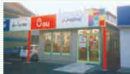
A-TY-12坪(フラット) ※オプションにて外壁の変更出来ます。