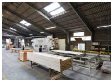
特殊加工用三次元カット機