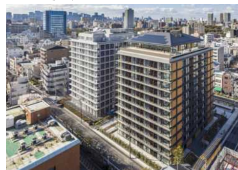
フラッツウッズ木場