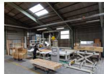
合板・サイディングプレカット装置