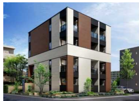
Forterb フォルターブ試作棟