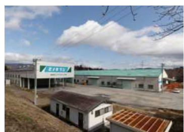
ヒノキブン三重CLT工場 （外観）