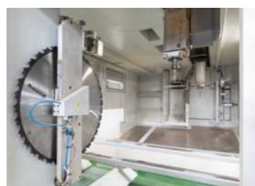
ユニチーム ウルトラ （内部）