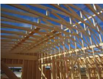
保育園特殊トラス