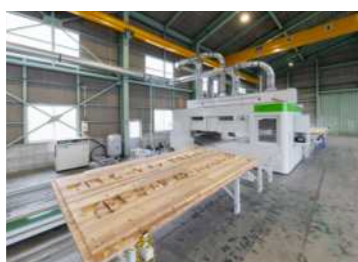
ユニチーム ウルトラ （CLTパネル加工機）