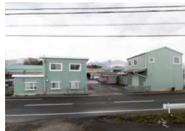
ヒノキブン三重支店/三重工場